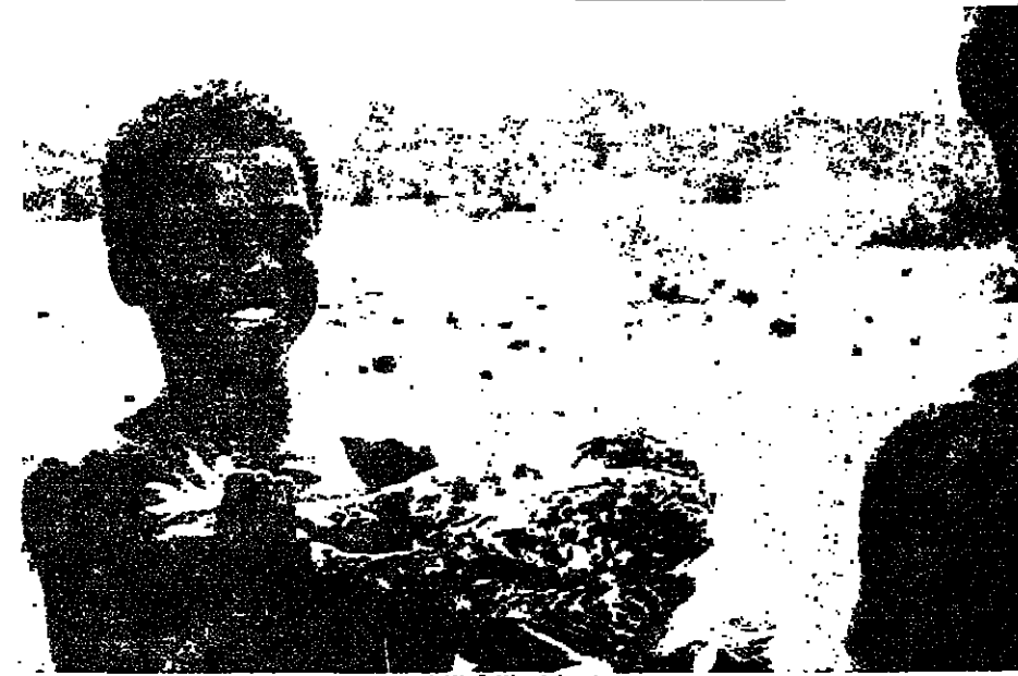
السينما ونظرة الأولاد